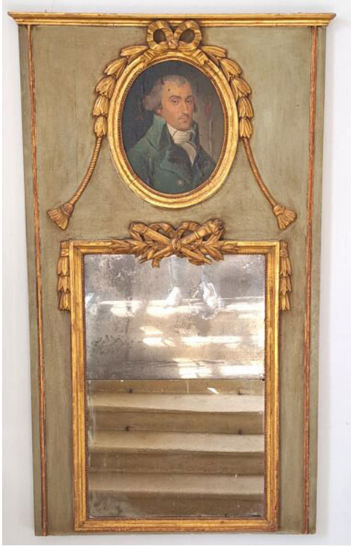
TRUMEAU LOUIS XVI À MOTIF D'UN MÉDAILLON OVALE ENCADRANT UNE HUILE SUR TOILE À L'IMAGE D'UN GENTILHOMME, coiffé de branches de lauriers nouées par un ruban. XVIII ème . Bois peint et doré. 187 x 104 cm.