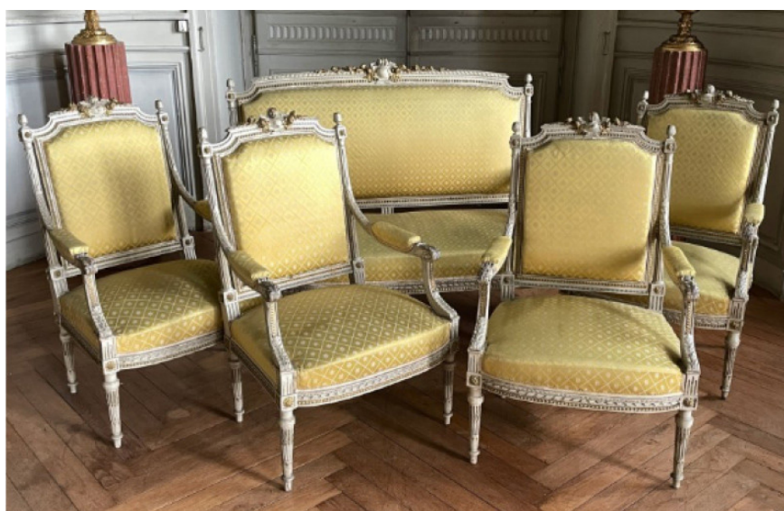
SALON EN BOIS MOULURÉ DE STYLE LOUIS XVI COMPOSÉ D'UNE BANQUETTE ET DE QUATRE FAUTEUILS 400 € - 600€