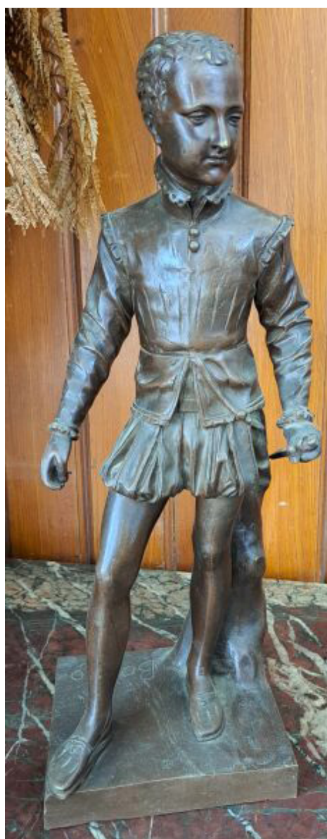
FRANÇOIS JOSEPH BOSIO (1768-1845), PORTRAIT EN PIED D'HENRI DE NAVARRE (LE FUTUR HENRI IV). EPREUVE EN BRONZE AVEC TRACES D'ARGENTURE, FONTE D'ÉDITION ANCIENNE SIGNÉE SUR LA PLINTHE DU SOCLE.

Le prince, âgé d'environ dix ans, est fièrement campé, la main gauche tenant le pommeau de son épée, la droite retombant avec nonchalance. L'allure à la fois grave et juvénile est pleine de charme. L'effigie participe de la propagande dynastique des Bourbons sous la Restauration. Ils utilisaient leur glorieux passé et le potentiel affectif du fondateur de la dynastie, Henri IV, pour valoriser leur image auprès du public. Bosio fut bien en cour quel que fût le régime : sculpteur familial de Napoléon Ier, premier sculpteur du roi Louis XVIII, il reçut de Charles X le titre de baron. La statue constitue une exception dans l'oeuvre de ce maître du néo-classicisme, sculptant dans la grande tradition de Canova. Hauteur : 43 cm.