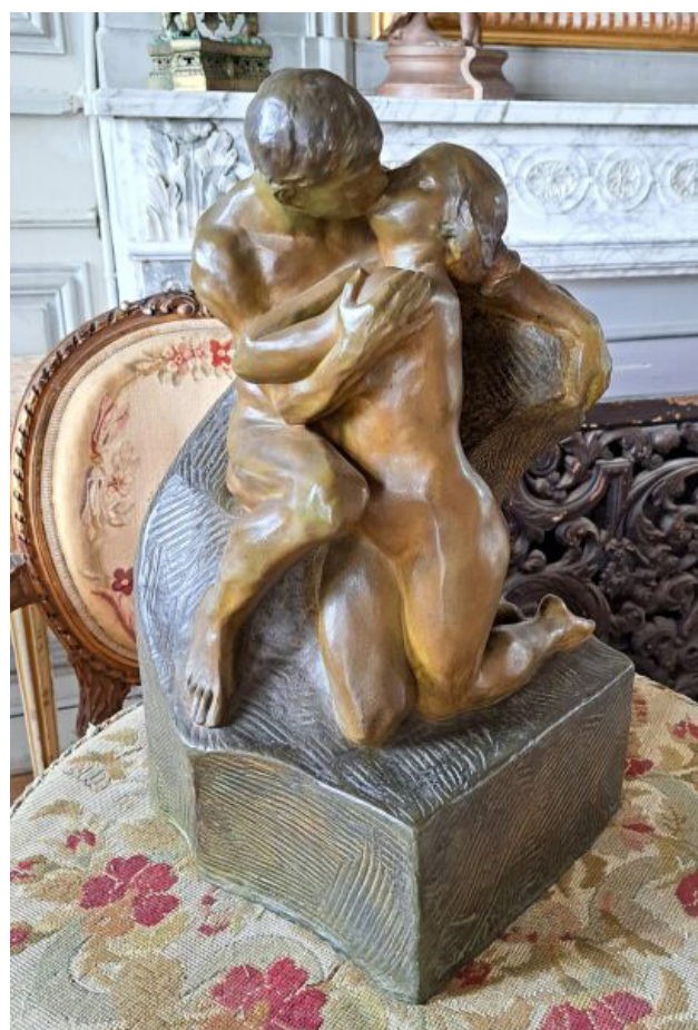
SALEZIO LUIGHI (XIX ÈME -XX ÈME ) D'APRÈS RODIN, GROUPE EN BRONZE LE BAISER,