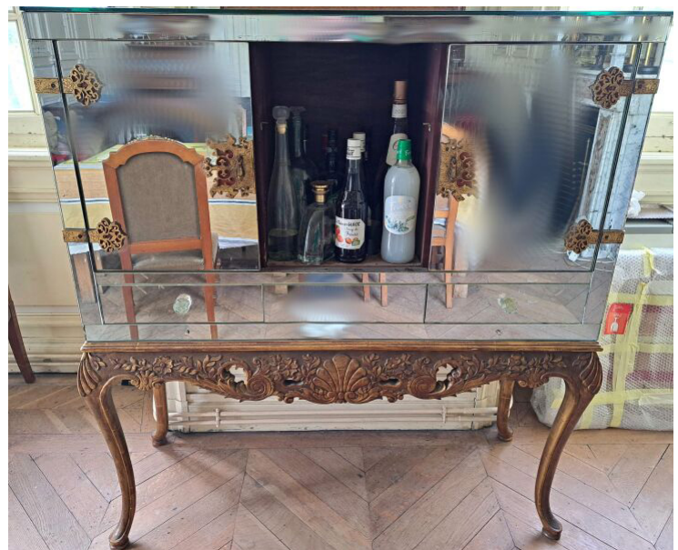
BAR À PARTIE SUPÉRIEURE MIROIR ET PIÉTEMENT EN BOIS DORÉ

Travail italien, Art Déco, 128 x 143 x 45 cm