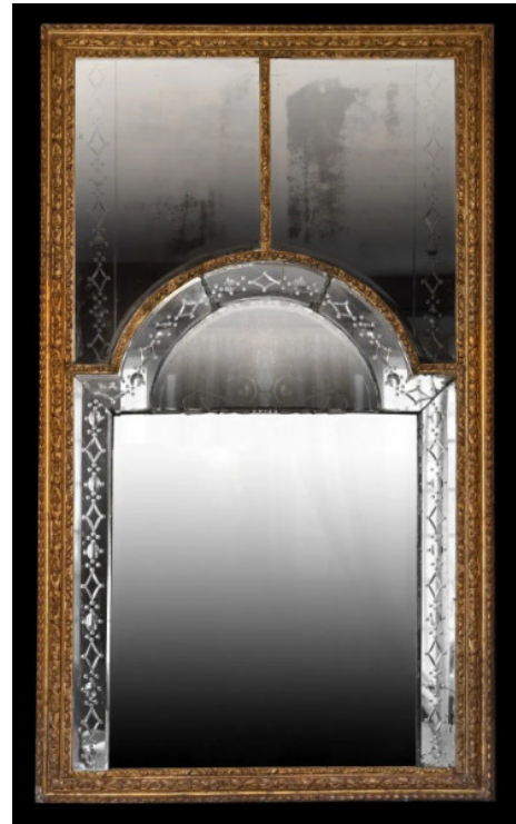
ITALIE XVIII ÈME - MIROIR COMPOSÉ D'UN PANNEAU DIT EN CHAPEAU DE GENDARME, DONT LES BORDS SONT EN VERRE BISEAUTÉ GRÉVÉ À DÉCOR D'UNE FRISE D'ENTRELACS,

surmonté par deux panneaux ornés de la même frise d'entrelacs. Cadre décoré d'une frise de lauriers, de feuillages et fleurettes et d'entrelacs, dit à la Bérain. Bois doré Hauteur 205 cm - Largeur 120 cm.