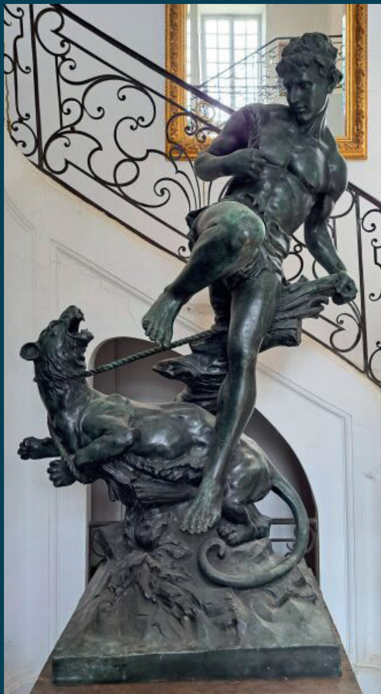
RUBIN (XIX ÈME ), «HÉRCULE TERRASSANT LE LION DE NÉMÉE», grande sculpture en bronze à patine verte brun, hauteur : 199 cm 10 000€ - 15 000€