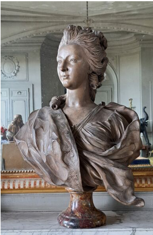
D'APRÈS AUGUSTIN PAJOU - EPREUVE ANCIENNE D'UN BUSTE EN TERRE CUITE DE MADAME DUBARRY SUR SOCLE, époque fin XVIII ème - début XIX ème , hauteur : 82 cm