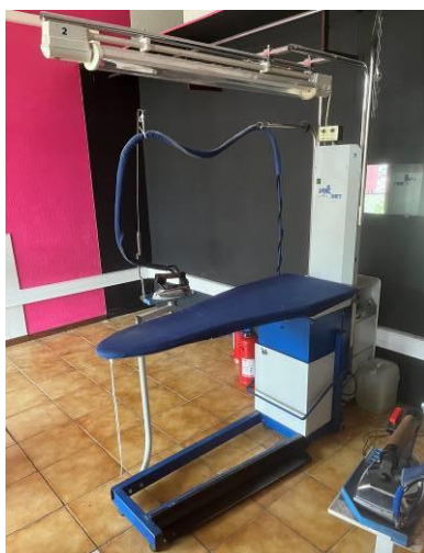
Table de repassage VEIT modèle 2332 complète avec son fer à repasser et son système d'éclairage