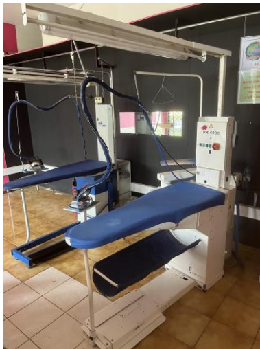
Table de repassage COVEMAT modèle PR4006 avec son bras de fonctionnement, son fer, ses 2 tables et sa rampe d'éclairage en partie supérieure