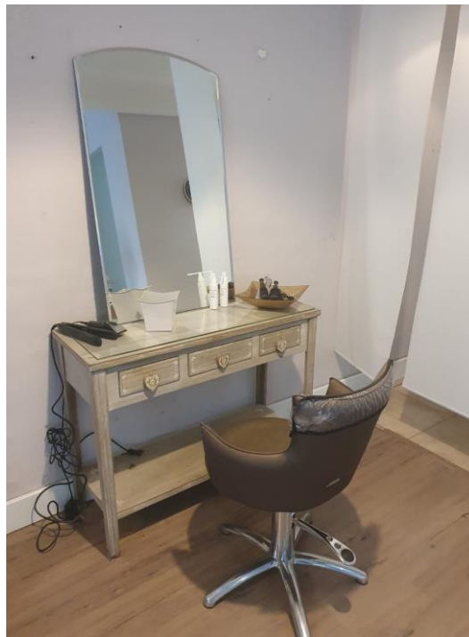
Un meuble en bois avec un miroir