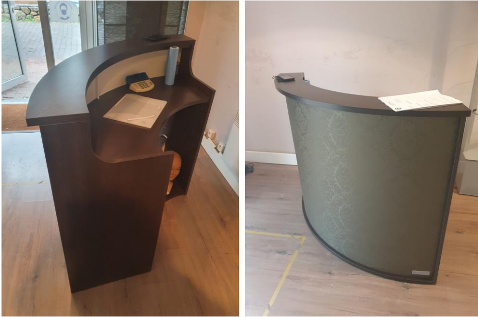
Un comptoir en aggloméré