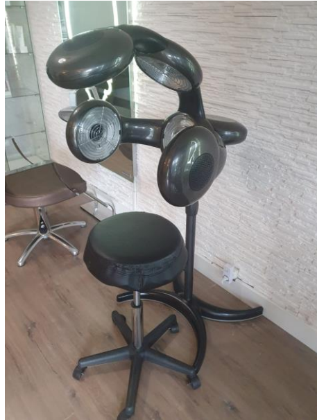
Un climazon, d'aspect récent